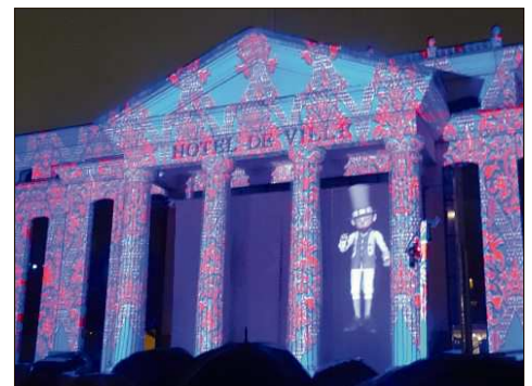
Même sous les parapluies, la magie de Noël.