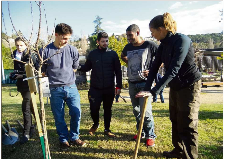
Le conseil des jeunes est venu prêter main-forte pour planter les arbres qu'ils entretiendront toute l'année avec les enfants du centre de loisir.

(1) Communauté d'agglomération Sophia Antipolis.