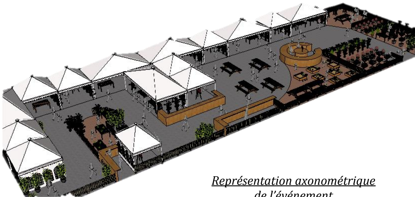
Représentation axonométrique de l'événement

Si nous venions à collaborer ensemble, la ville d'Antibes deviendrait le symbole de la prise de conscience environnementale dans les paysages méditerranéens. Grâce à cet événement, vous mettez en valeur votre sensibilité au changement climatique et au respect de la biodiversité aux yeux de vos concitoyens. Cet événement ludique et dynamique interpellera les passants et créera de l'animation.